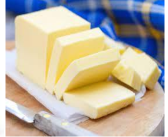
du beurre du beurre