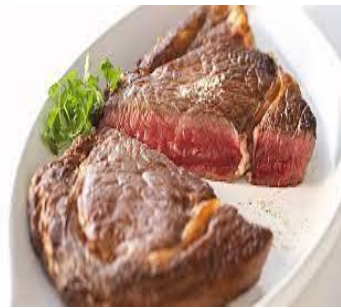
de la viande de la viande