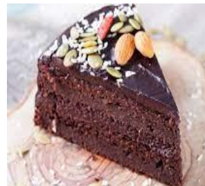
du gâteau du gâteau