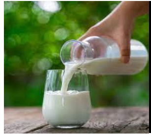
du lait du lait