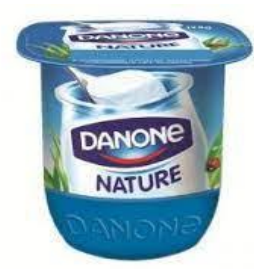
du yaourt du yaourt