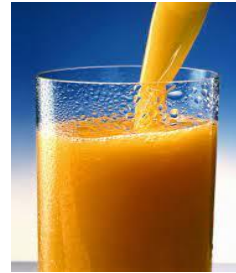
du jus du jus