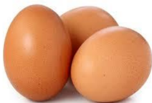
des œufs des œufs