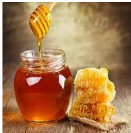
du miel du miel