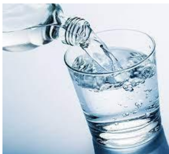
de l'eau de l'eau