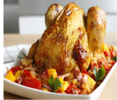
un poulet un poulet