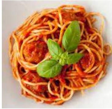
des pâtes des pâtes