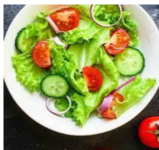
de la salade de la salade