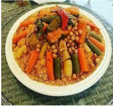
le couscous le couscous