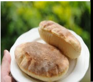
du pain du pain