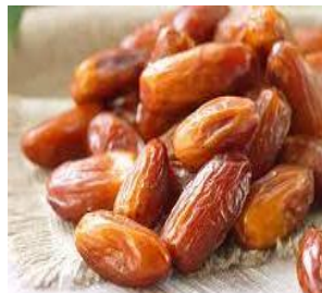
des dattes des dattes