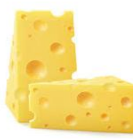
du fromage du fromage