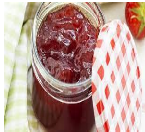
de la confiture de la confiture