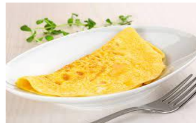
une omelette une omelette