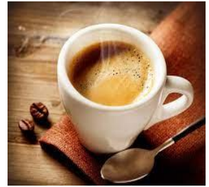
du café du café