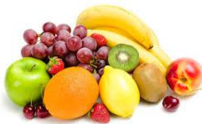
les fruits les fruits