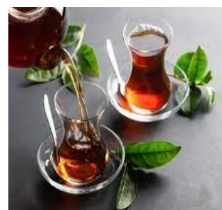
du thé du thé